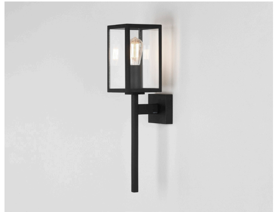
CODE: 1369005 FINISH: TEXTURED BLACK

THIS PRODUCT IS NOT SUITABLE FOR INSTALLATION WITHIN FIVE MILES OF THE COAST. FOR THESE ENVIRONMENTS, PLEASE FILTER PRODUCTS ON THE ASTRO WEBSITE BY 'COASTAL'.